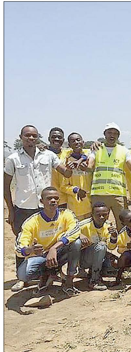
«NYE DRAKTER»: Eit fotballag i idrettslag.

Har du rund dag og ikkje ynskjer namnet ditt i avisa, kontakt Sogn Avis, seinast fire virkedagar før.